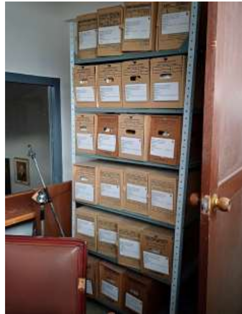
Deposito 2 Oficina de reuniones